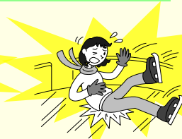
スケートでケガをした