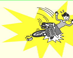
自転車で転倒してケガをした