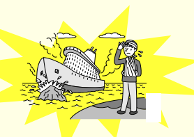
旅客船が座礁してケガをした